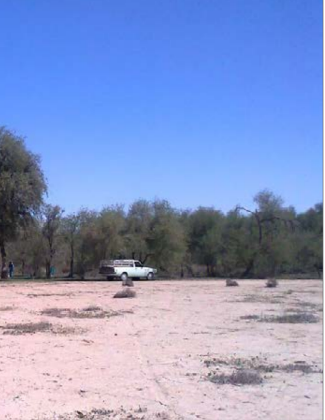
با توجه به اقلیم گرم و خشک استان کرمان، وجود چنین نعمت‌های خدادادی علاوه بر