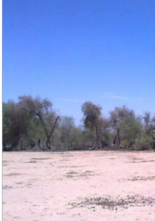
با توجه به اقلیم گرم و خشک استان کرمان، وجود چنین نعمت‌های خدادادی علاوه بر

فرماندار فاریاب:حفر کانال در اطراف جنگل «مهرویه» غیر اصولی بوده است