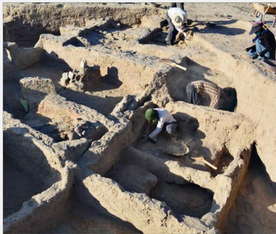
رییس سازمان میراث فرهنگی خبر داد: