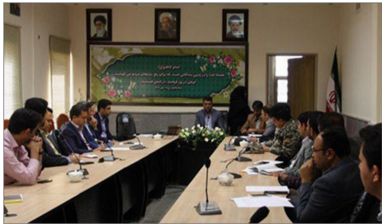
معاون املاک و حقوقی

بر آمادگی کامل گشت زنی در حوزه استحفاظی املاک و کنترل و نظارت بر املاک دولتی و جلوگیری از تصرفات اراضی در ایام نوروز و تعطیلات را بیان و تاکید کرد که در این ایام بایستی گشت های یگان حفاظت به صورت شبانه روزی در حوزه شهر ستانها بطور مستمر و مداوم گشت زنی داشته باشند و در صورت مشاهده هر گونه تصرف بلافاصله نسبت به رفع آن اقدام وفورا مراتب را به کشیک های اداره کل اطلاع دهند همچنین معاون املاک و حقوقی، فرمانده یگان و مدیر حراست موظف به نظارت بر این امر هستند. در ادامه معاون املاک و حقوقی اداره کل راه و شهرسازی جنوب کرمان با تاکید مجدد بر گشت زنی هذمفند به صورت صبح و عصر و در صورت مشاهده هر گونه تصرف بلافاصله نسبت به رفع آن اقدام وفورا مراتب را به کشیک های اداره کل اطلاع دهند همچنین معاون املاک و حقوقی، فرمانده یگان و مدیر حراست موظف به نظارت بر این امر هستند. در ادامه معاون املاک و حقوقی اداره کل راه و شهرسازی جنوب کرمان با تاکید مجدد بر گشت زنی هذمفند به صورت صبح و عصر و در صورت مشاهده هر گونه تصرف بلافاصله نسبت به رفع آن اقدام وفورا مراتب را به کشیک های اداره کل اطلاع دهند همچنین معاون املاک و حقوقی، فرمانده یگان و مدیر حراست موظف به نظارت بر این امر هستند. در ادامه معاون املاک و حقوقی اداره کل راه و شهرسازی جنوب کرمان با تاکید مجدد بر گشت زنی هذمفند به صورت صبح و عصر و در صورت مشاهده هر گونه تصرف بلافاصله نسبت به رفع آن اقدام وفورا مراتب را به کشیک های اداره کل اطلاع دهند همچنین معاون املاک و حقوقی، فرمانده یگان و مدیر حراست موظف به نظارت بر این امر هستند.