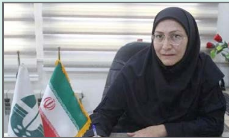
مدیرکل محیط زیست استان کرمان از برخورد قانونی با فعالیت‌های معدنی بدون مجوز در این استان خبر داد.

های مهم کرمان است و این استان به بهشت معادن مشهور است و طبیعی است که سرمایه گذاران جذب این ظرفیت می شوند. مدیر کل محیط زیست استان کرمان در خصوص کوپر لوت، گفت: زمانی که میراث فرهنگی کوپر لوت را ثبت جهانی کرد، نگرانی هایی به وجود آمد این بود که آفرود سواران بدون مجوز وارد منطقه می شدند و حدود ۵۱ گونه اندیمیک در کوپر لوت داریم و حتی گونه ای از حشرات کشف شده است که جذابیت محدوده را زیاد می کند و باعث جذب گردشگر می شود. مصوب شد که میراث فرهنگی برای آفرودسواران در کوپر محل خاصی تعیین کند تا آفرودسواران همه جای کوپر نروند و کسانی که به منظورهی مختلف ورود پیدا می کنند از محیط زیست نیز استعلام صورت بگیرد. وی در خصوص سم پاشی های هوایی برای مبارزه با ملخ ها، گفت: آفات عمومی آفاتی هستند که دولت متولی مبارزه با این آفات است. به دلیل اینکه این آفات، امنیت غذایی جامعه را تهدید می کنند؛ درمورد هجوم ملخ ها به دلیل اینکه امکان سم پاشی زمینی وجود نداشت از سم پاشی هوایی استفاده شد.