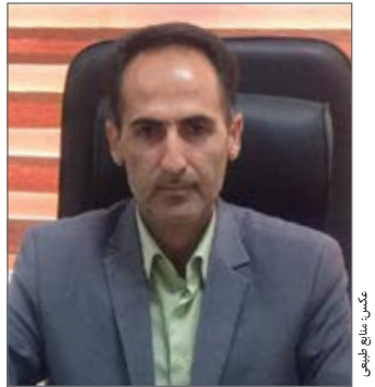
کسب منابع طبیعی