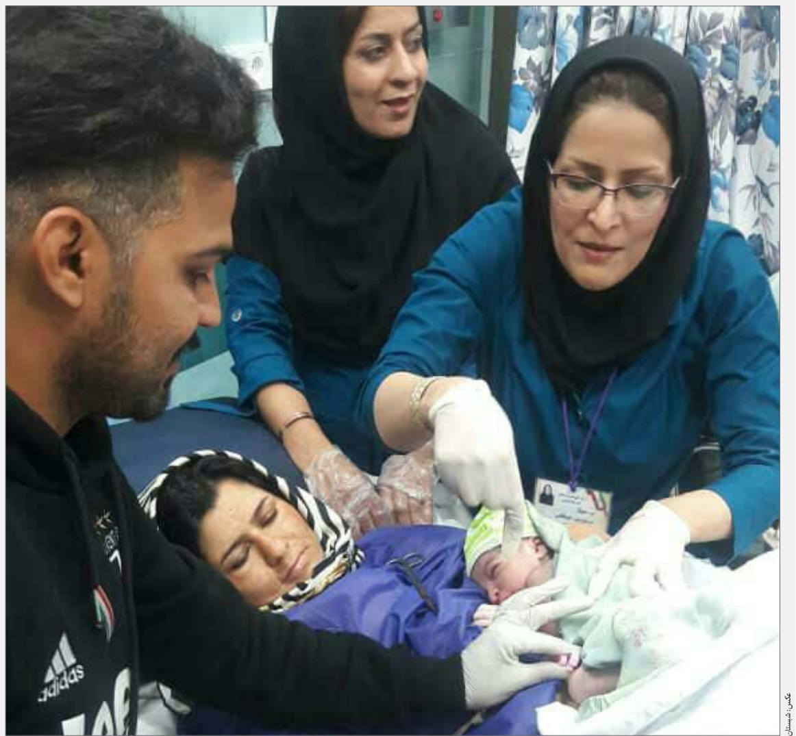
کسب منابع طبیعی