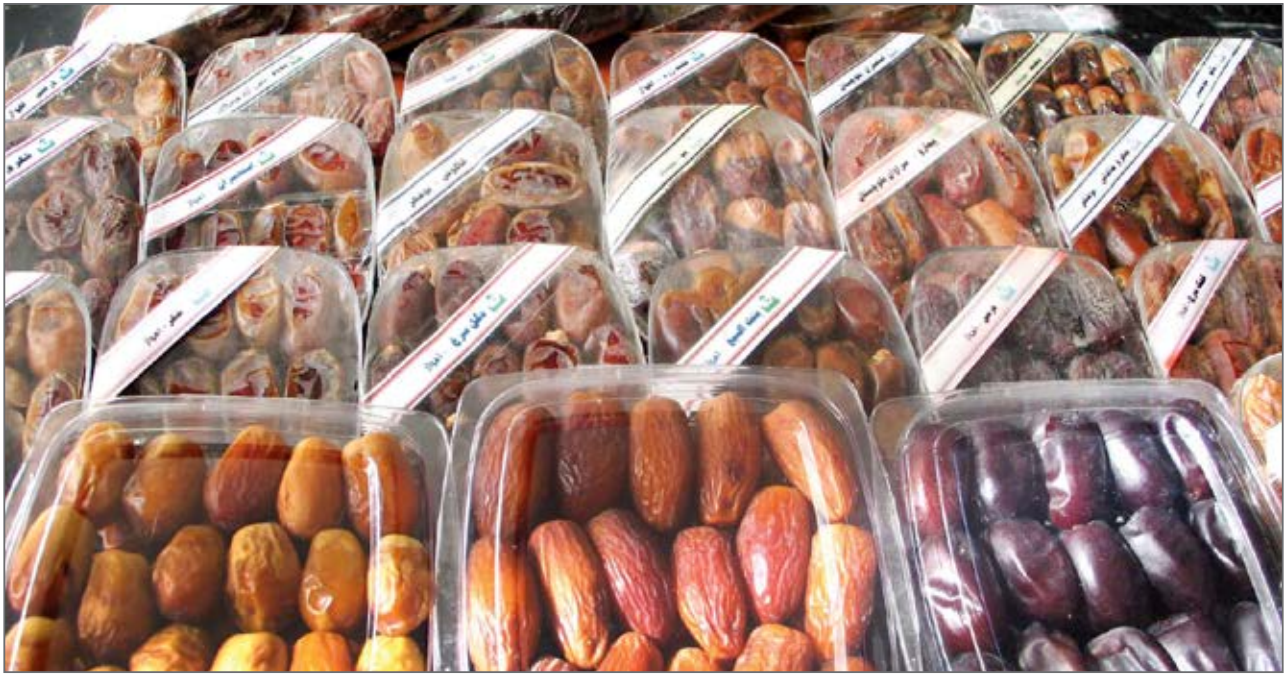
عکس از کشاورزان

نداشتن امکانات و توان مالی کم، صادرکننده نیستند. براساس آمار، از مجموع خرماي تولید شده در کشور در بازه زمانی ۹۷-۹۵، سهم صادرات از ۲۰۹ هزار تن به ارزش ۲۰۸ میلیون دلار به ۲۷۴ هزار تن به ارزش ۳۰۷ میلیون دلار افزایش داشته است. یعنی صادرات خرما رشد داشته است.