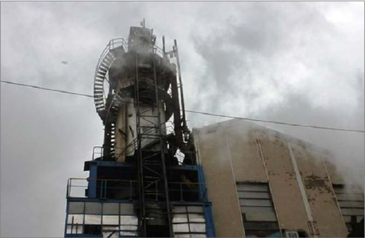
عکس گلپایز و

پورخاتون ادامه داد: «در صورتی که کارخانه راه بیفتد، می‌توانیم ۵۰۰تا ۲هزار هکتار را برای کشت این محصول تضمین کنیم تا نیاز کارخانه برطرف شود.»