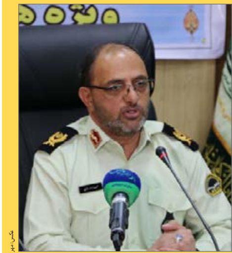
عکس گلپایز و

متنوع و مختلفی پیش رو داریم در دراستای انجام آن‌ها اقتدار و شکوه نیروی انتظامی به نمایش گذاشته شود.