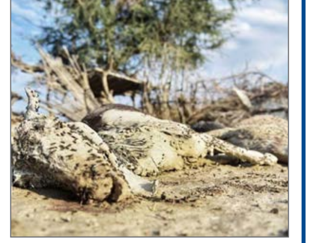
تصاویر اتلاف شمار زیادی از احشام بر اثر سیلاب جنوب سیستان و بلوچستان را نشان می دهد.