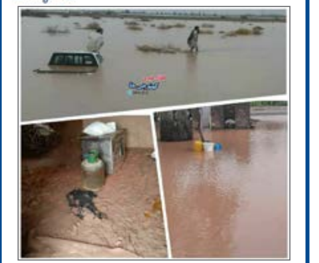
از صفحه کهنوجی ها/گوشه ای از خسارت بارندگی اخیر مناطق روستایی شهرستان رودبار جنوب