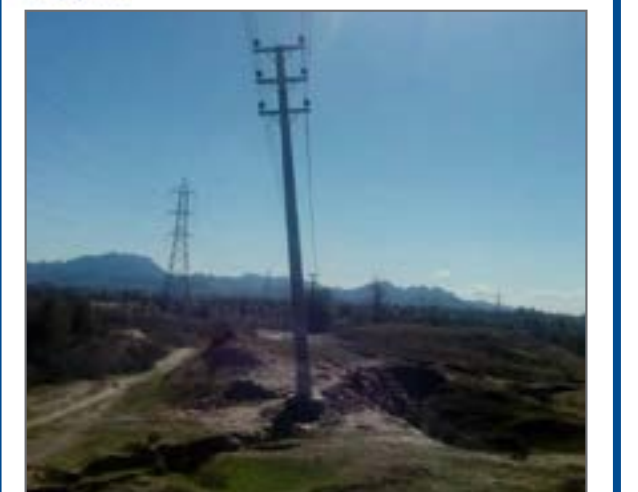
تیر برق معلق در محله اختیاریاد سرکهن که هر لحظه امکان سقوط آن در گسل وجود دارد و نیازمند اصلاح است از صفحه kahnujuiha