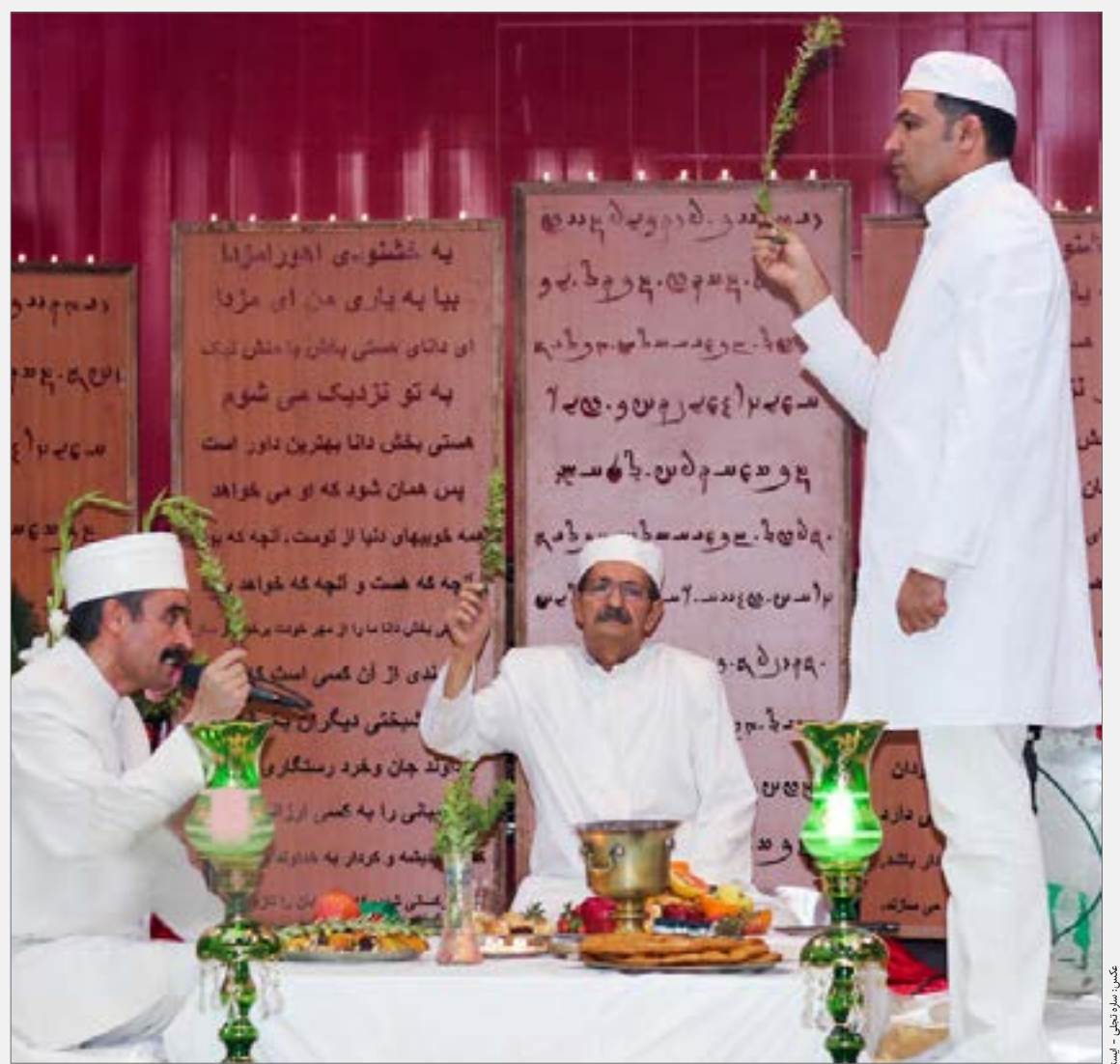
کسب عنوان «سده»