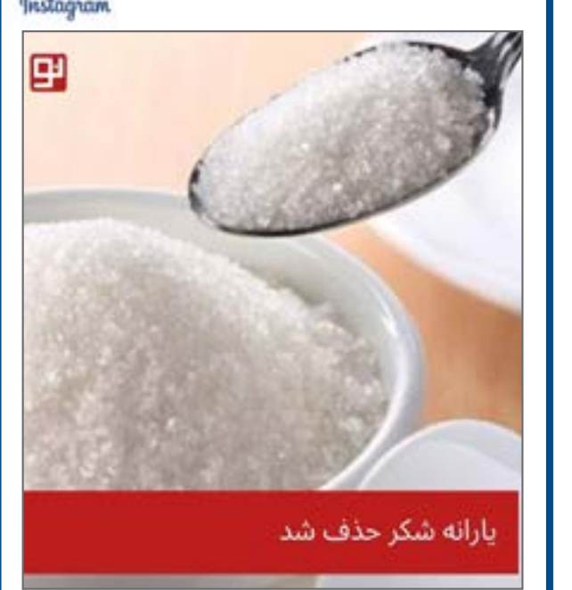
با حذف از ۴۲۰۰ تومانی به واردات شکر پارانه اختصاصی برای واردات این محصول حذف شد و از گروه یک به گروه دو کالاهای وارداتی تغییر یافت از صفحه kermame_no