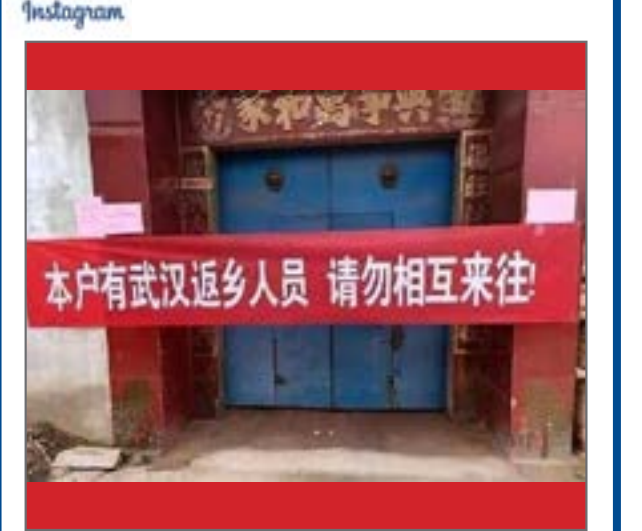
علامت گذاری خانه مبتلایان به ویروس کرونا در چین! در چین مقابل خانههایی که ساکنانش ویروس کرونا دارند این پارچه قرمز نصب شده و رفت و آمد به این خانهها ممنوع است.