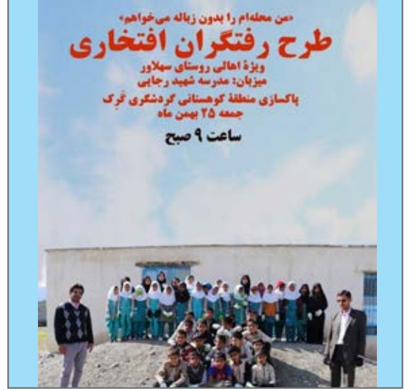
طرح رفنگران افتخاری ویژه اهالی روستای سهلاور کهنوج