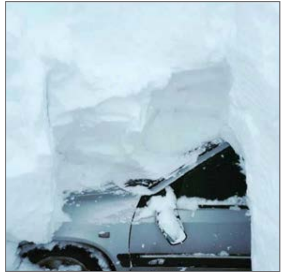
اردبیل در برف