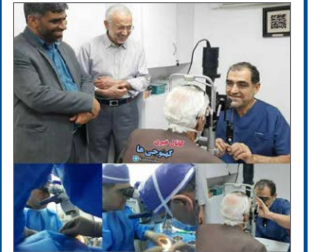
برای اولین بار در تاریخ استان انجام پیوند قرنیه در زهکوت انجام شد. از صفحه kahnjujia