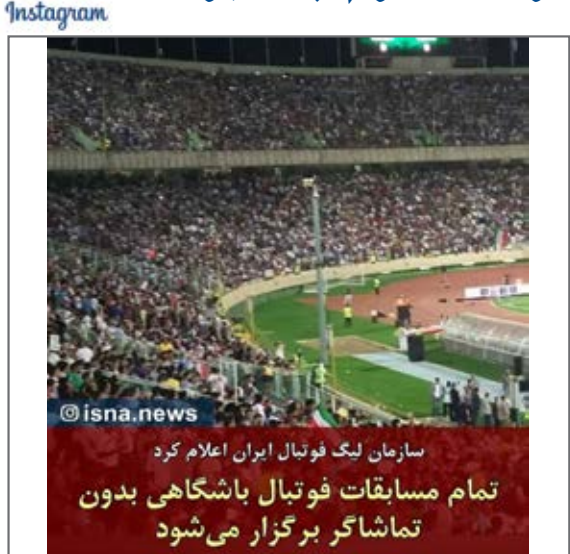
تمام بازی های فوتبال باشگاهی بدون تماشاگر برگزار می شود.