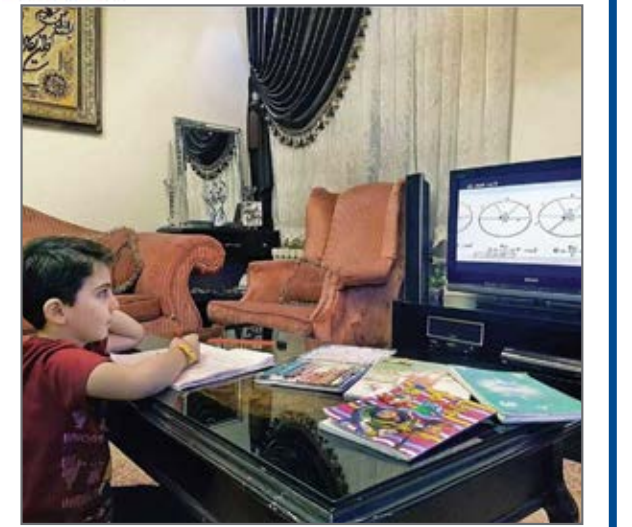
درس و مشق زیر سایه کرونا از صفحه hamshahrineews