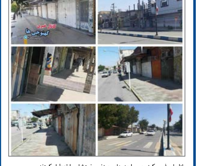
بازاریان فهیم کهنوجی واحد های صنفی خودشان را تعطیل کردند. از صفحه kahnuija