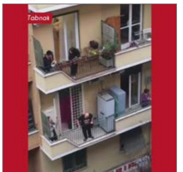
مردم ایتالیا برای روزهای قرنطینه قرار گذاشته اند هر روز ساعت شش غروب بیایند در تراس هایشان و آواز بخوانند. از صفحه tabnak