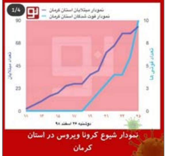
نمودار شیوع کرونا در استان کرمان صعودی است.