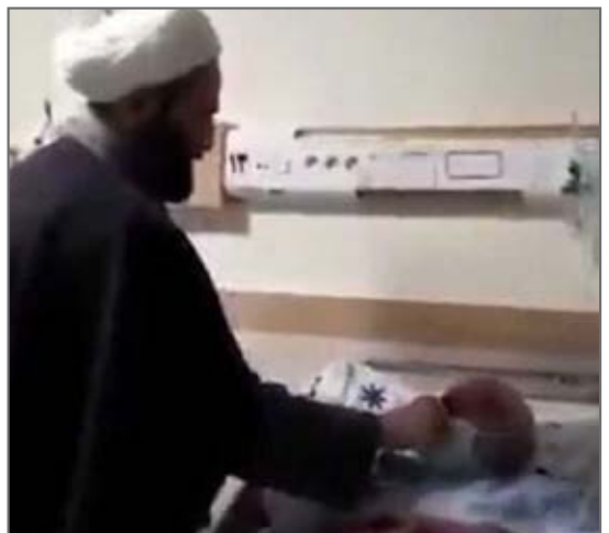
روحانی مدعی طب سنتی بازداشت شد. از صفحه ima_۱۳۱۲