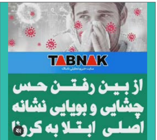
از بین رفتن حسن چشایی و بویایی از علایم اصلی کرونا است. از صفحه tabnak