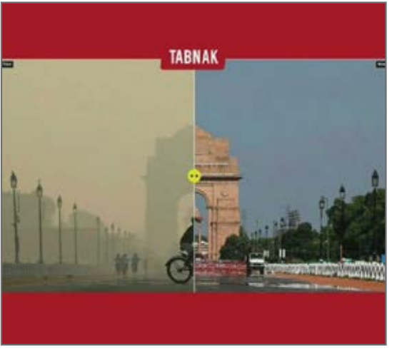
مقایسه دهلی نوبل و بعد از کرونا از صفحه tabnak