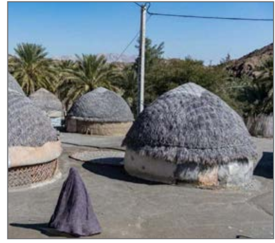
داستان کبر... از صفحه isna.news