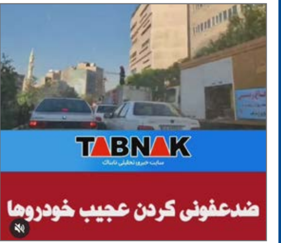
در تهران خودروها را ضد عفونی می‌کنند