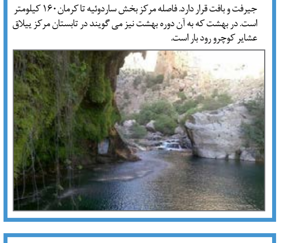
بیلاق درب بهشت ( در هزار ) این بیلاق در مرکز بخش ساردوئیه از بخش‌های شهرستان جیرفت و در مسیر جاده راین به جیرفت و بافت قرار دارد. فاصله مرکز بخش ساردوئیه تا کرمان ۱۶۰ کیلومتر است. در بهشت که به آن دوره بهشت نیز می‌گویند در تابستان مرکز بیلاق عشایر کوچ‌رو رود بار است.