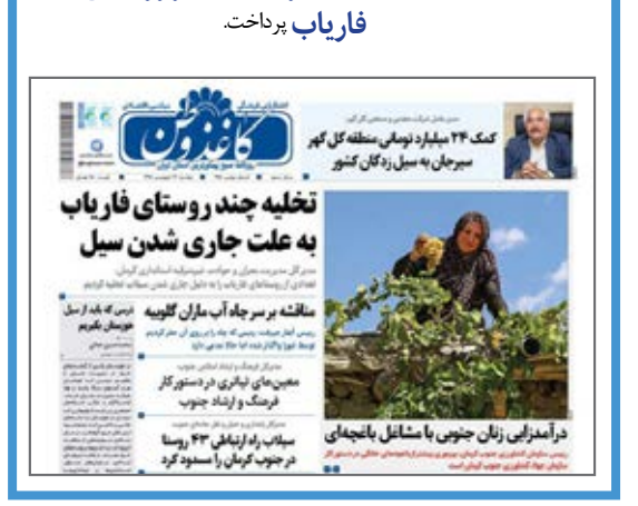
در سال گذشته در چنین روزی کاغذ وطن به خسارت سیل در روستای فاراب پرداخت.