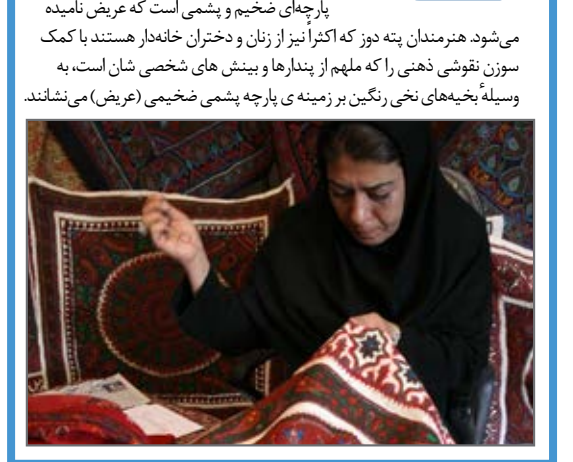
پته دوزی نوعی از روزه‌های کرمان است. پارچه زمینه پته پارچه‌های ضخیم و پشمی است که عریض نامیده می‌شود. هنرمندان پته دوز که اکثر آن‌ها زن و دختران خانه‌دار هستند با کمک سوزن نقوشی ذهنی را که ملهم از پندارها و بینش‌های شخصی‌شان است، به وسیله بخیه‌های نخی رنگین بر زمینه‌ی پارچه پشمی ضخیمی (عریض) می‌نشانند.