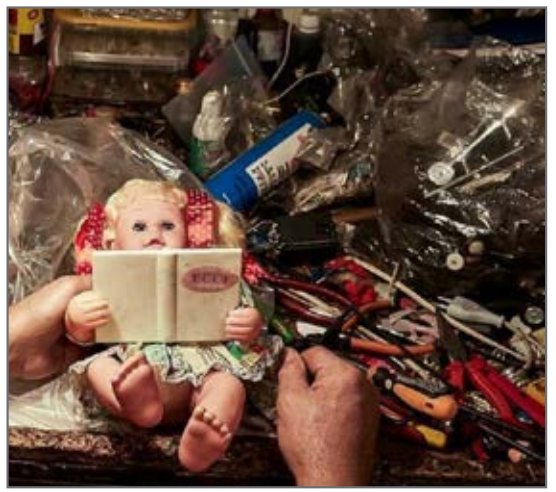
ماجرای پزشک اسباب بازی‌ها... از صفحه isna.news