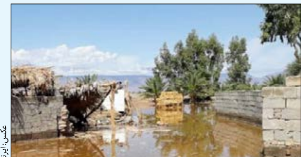
برای امدادسانی به منطقه انجام شده افزود: تا ساعت ۵ صبح ۲۹ فروردین تمام مسیرهای روستایی بازگشایی و دسترسی به تمام مناطق سیل‌زده برای امدادسانی زمینی امکان پذیر شد. وی ادامه داد: ۲ راه اصلی مسدود شد ادامه داد: قطعی برق ۲۰ روستا، قطعی آب ۷ روستا و قطع ارتباطات مخابراتی ۱۰ رادر منطقه داشتیم. معاون عمرانی استاندار کرمان با ابراز تألم و تأثر از بلافاصله هماهنگی‌های لازم

این وجود ۲ نوبت امدادسانی هوایی نیز به مردم سیل زده منطقه داشتیم و نیروهای جمعیت هلال احمر و راهداری از ساعات اولیه وقوع سیل در منطقه حاضر بودند. آیت‌اللهی موسوی با اشاره به اینکه در همان روز اول برق تمام روستا به طور موقت وصل شد افزود: در حال حاضر برق پایدار در تمامی روستاها، آب و ارتباطات برقرار شده است. وی با بیان اینکه در مرحله تخلیه گل و لای و لجن داخل منازل هستیم و کار آن تقریباً به اتمام رسیده است گفت: خوشبختانه در سیل اخیر تلفات جانی نداشتیم اما میزان تخریب‌ها در حوزه‌های مختلف چون کشاورزی و راه‌ها بسیار زیاد است.