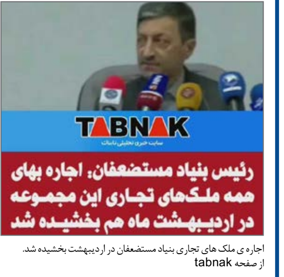
اجاره ای ملک های تجاری بنیاد مستضعفان در اردیبهشت بخشیده شد. از صفحه tabnak