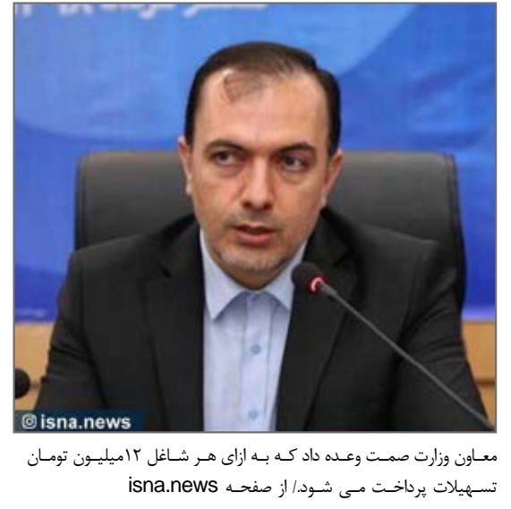
معاون وزارت صمت وعده داد که به ازای هر شاغل ۱۲ میلیون تومان تسهیلات پرداخت می‌شود.