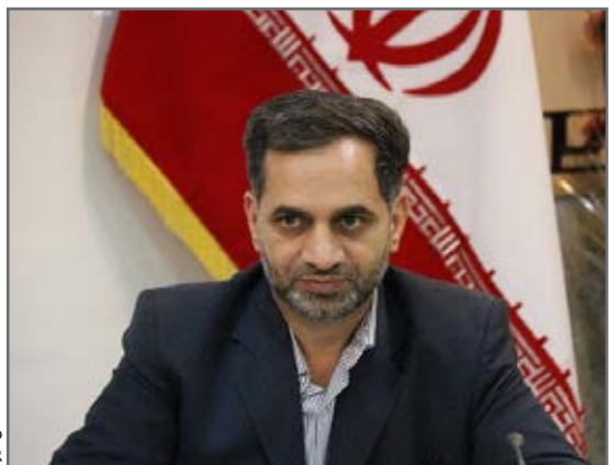
پرونده قضائی در دادسرای عمومی و انقلاب کرمان تشکیل و دستورات و سقم موضوع مطرح و در صورت صحت جرایم و شناسایی عاملان امر،

قضائی برای توقف کار و خودداری از قطع درختان صادر شد. سالاری کرمان افزود: جنگل قائم به عنوان یکی از جنگل‌های دست‌کاشت ایران به شمار و حفظ و حراست از آن به عنوان عامل تهویه هوای شهر کرمان و کاهش آلودگی‌های هوایی و بهبود محیط زیست الزامی بوده و ضرورت دارد که متولیان امر حفاظت از آن، بیش از سایرین در حفظ و حراست این میراث کوشا باشند. دادستان کرمان در پایان یادآور شد: من باب حقوق مردم و دفاع از آن به عنوان مدعی العموم اجازه تعرض به جنگل‌ها و منابع طبیعی و محیط زیست را نخواهیم داد.