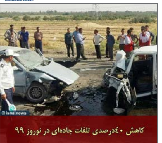
تلفات جاده‌ای در نوروز ۹۹ کاهش ۴۰ درصدی تلفات جاده‌ای در نوروز ۹۹ از صفحه isna.newsi