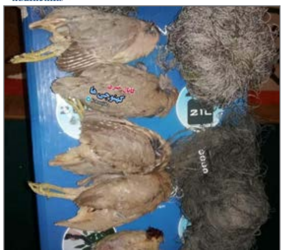
شکارچیان غیر مجاز در کهنوج دستگیر شدند.