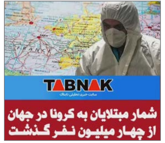
شمار مبتلایان در جهان از چهار میلیون نفر گذشت