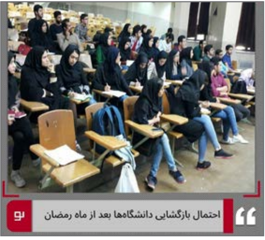
احتمال بازگشایی دانشگاهها بعد از ماه رمضان