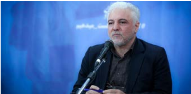
تخصیص ارز طی دو ماه گذشته در خرداد ماه محقق شده است.