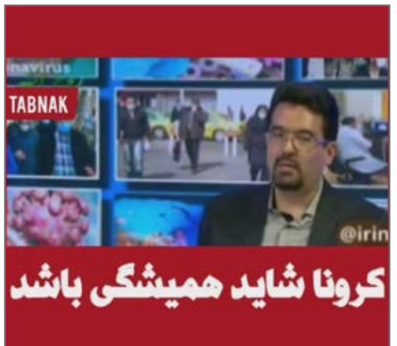
دکتر مصطفوی، اپیدمیولوژیست: براساس دانسته ها، انتظار نداریم کرونا از جهان پاک شود. از صفحه tabnak