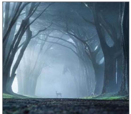
تصاویری از پارک ملی سن روسور در ایتالیا