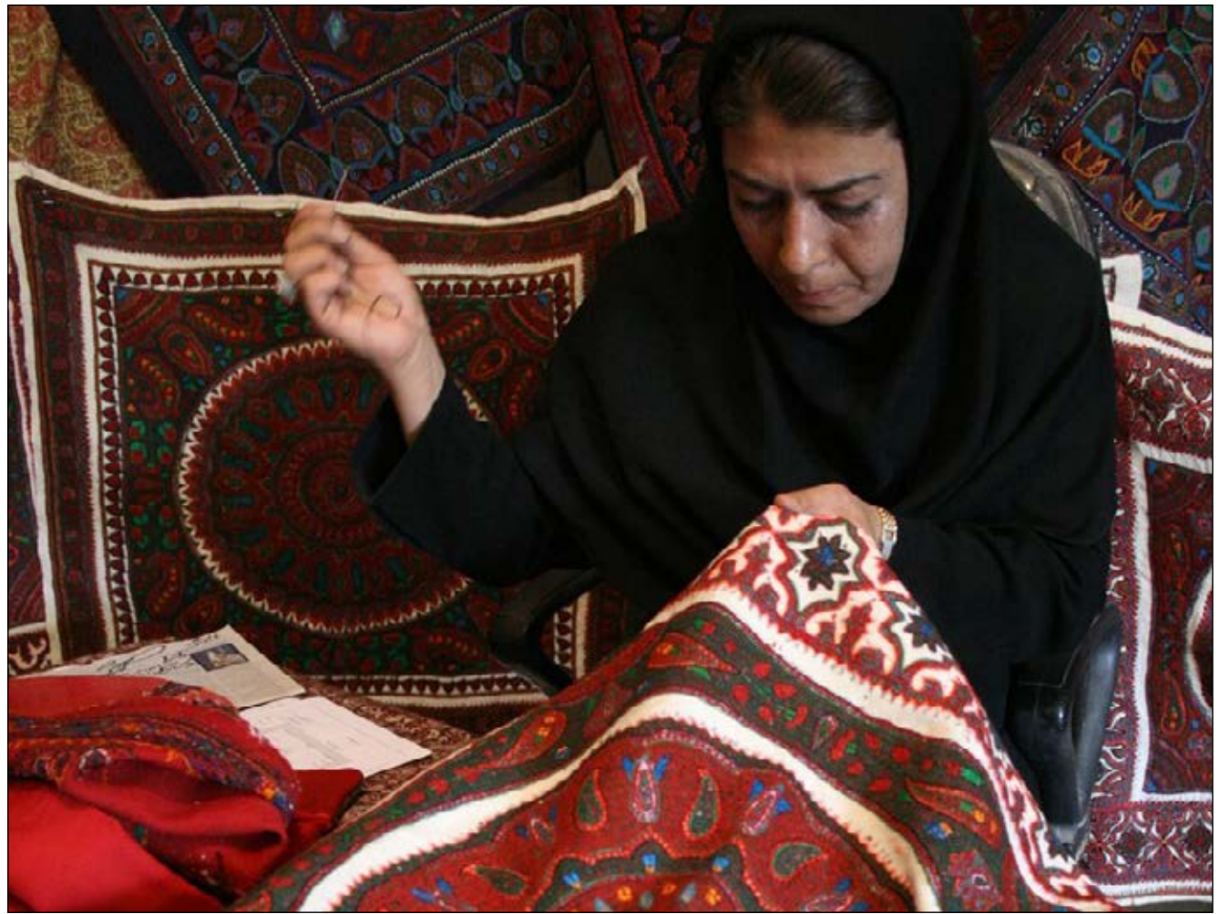
عکس: کرمان شناسی

سرپرست معاونت صنایع دستی اداره کل میراث فرهنگی: بازارچه صنایع دستی استان از ۲۰ خرداد به مدت ۱۰ روز در فضای روباز هتل پارس دایر می‌شود