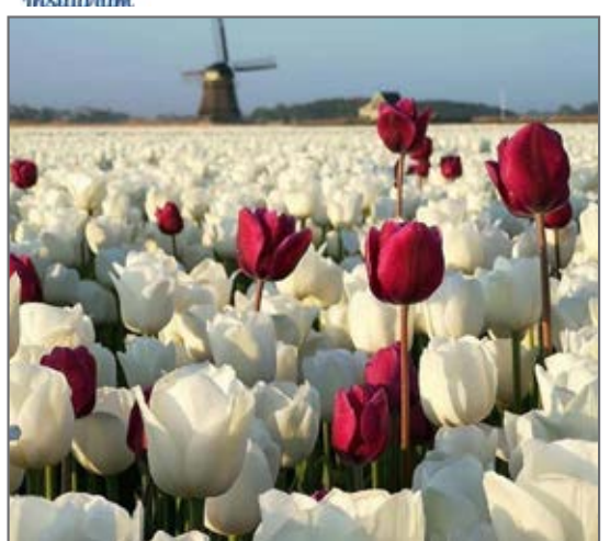
تصاویری از باغ لاله در هلند