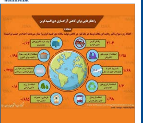
سالانه مقدار زیادی دی‌اکسید کربن در کره زمین تولید می‌شود و همین مسأله اثرات منفی مختلفی بر محیط زیست دارد.