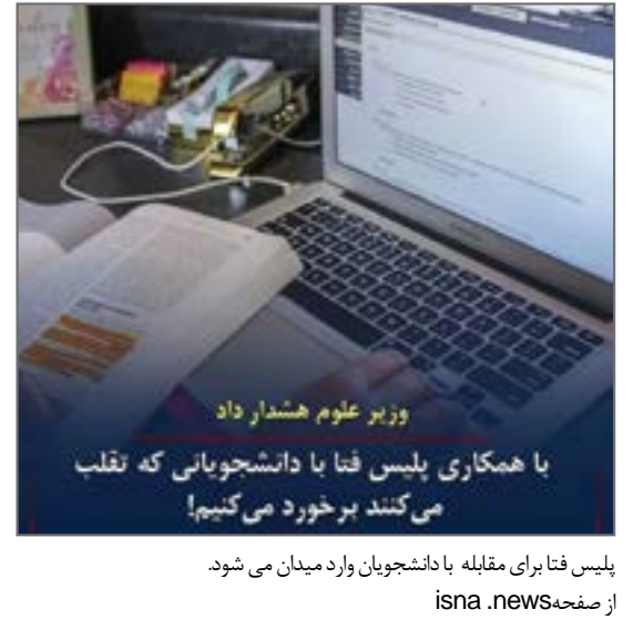
پلیس فتا برای مقابله با دانشجویان وارد میدان می شود.