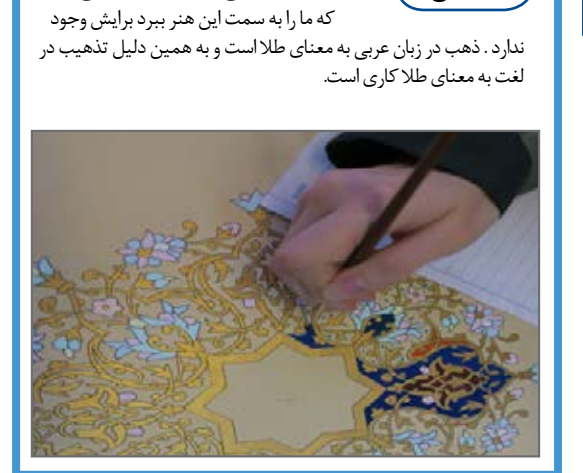
تذهیب یک واژه ی عربی است و معنا و تعریفی دقیق که ما را به سمت این هنر ببرد. برایش وجود ندارد. تذهیب در زبان عربی به معنای طلا است و به همین دلیل تذهیب در لغت به معنای طلاکاری است.