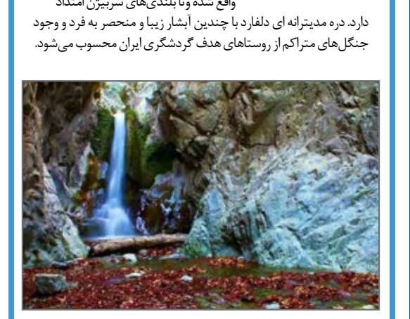
درهٔ دلفزار در ۲۵ کیلومتری شمال شهر باستانی جیرفت واقع شده و تا بلندی های سربین امتداد دارد. دره مدیترانه ای دلفزار با چندین آبشار زیبا و منحصر به فرد و وجود جنگل های متراکم از روستاهای هدف گردشگری ایران محسوب می شود.