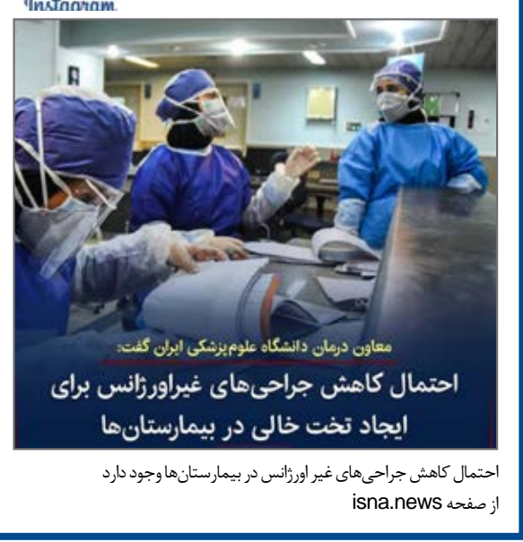
احتمال کاهش جراحی های غیر اورژانس در بیمارستان ها وجود دارد