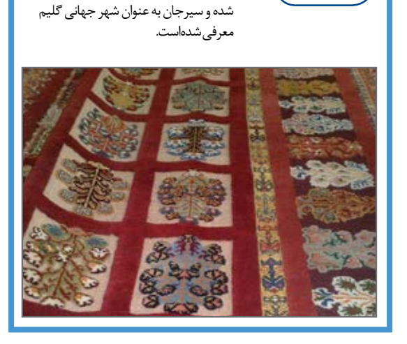
گلیم شیرینی پیچ این نوع گلیم در میراث جهانی یونسکو ثبت شده و سرچان به عنوان شهر جهانی گلیم معرفی شده است.