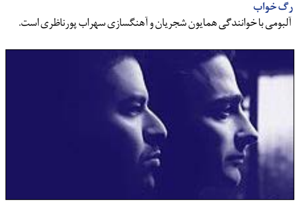
رگ خواب آلبومی با خوانندگی همایون شجریان و آهنگسازی سهراب پورناظری است.