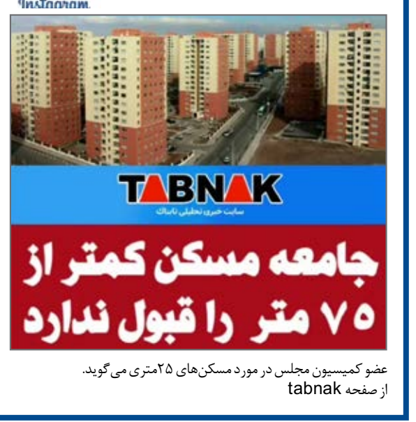
عضو کمیسیون مجلس در مورد مسکن های ۲۵ متری می گوید. از صفحه tabnak