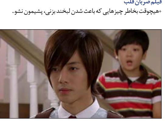
فیلم ضربان قلب +هیجوقت بخاطر چیزهایی که باعث شدن لبخند بزنی، بشیومن نشو..