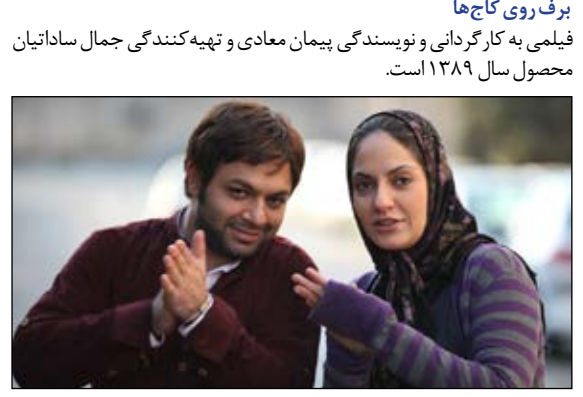
برف روی کاجها فیلمی به کارگردانی و نویسندگی پیمان معادی و تهیه کنندگی جمال ساداتیان محصول سال ۱۳۸۹ است.