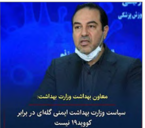
معاون وزارت بهداشت: سیاست وزارت بهداشت ایمنی گله ای در برابر کوئید ۱۹ نیست. از صفحه isna.news