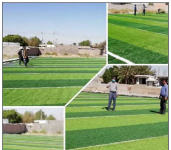
سومین چمن مصنوعی در بلوار آیت الله خامنه ای جیرفت نصب شد.