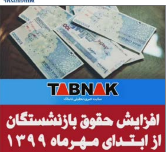
حقوق بازنشستگان از ابتدای مهرماه افزایش پیدا می‌کند.