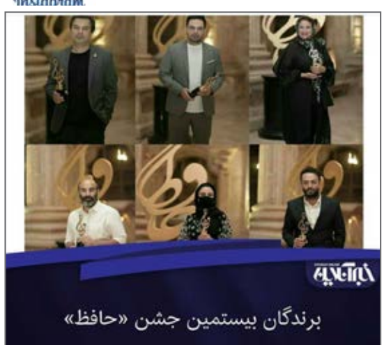
برندگان بیستمین جشنواره جشن حافظ