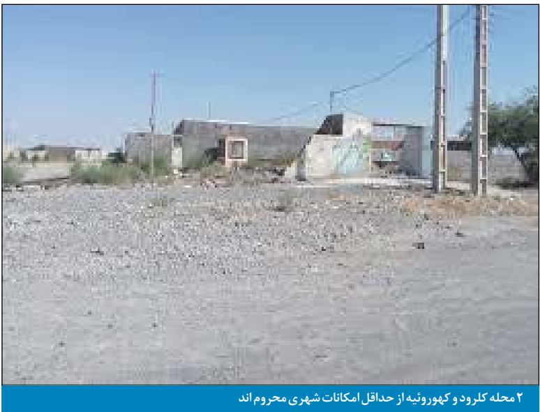
۲ محله کلرود و کهور وئیه از حداقل امکانات شهری محروم اند