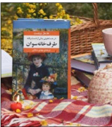
طرف خانه سوان

طرف خانه سوان جلد اول شاهکار به تمام معنای مارسل پروست است و بعد می‌دانم شما چند رمان خوانده باشید و اسم این رمان معروف یعنی در جستجوی زمان از دست رفته را نشنیده باشید. این رمان به قدری مشهور است که برخی از اصطلاحات آن وارد زندگی مردم شده است. مارسل پروست در سال ۱۸۷۱ در حومه پاریس به دنیا آمد. پدرش پزشکی سرشناس و مادرش فرزند یک دلال ثروتمند بورس بود. در همان سال‌های کودکی دچار بیماری اسم شد و برخی از تکان‌دهنده‌ترین صحنه‌های کتابش را به بیماری اختصاص داده است. سرانجام پروست در سال ۱۹۲۲ در گذشت اما دغدغه‌اش در سراسر عمر این بود که چگونه می‌تواند مانند پدرش فردی تاثیرگذار باشد و خدمت بزرگی انجام دهد. مارسل پروست با نوشتن بلندترین رمان جهان این خدمت بزرگ را به انجام رساند. طرف خانه سوان - عنوان جلد اول رمان هفت جلدی در جستجوی زمان از دست رفته - نخستین بار در سال ۱۹۱۳ منتشر شد. در ابتدا نویسنده قرار بود یک رمان سه جلدی منتشر کند اما با وقوع جنگ جهانی اول و خانه‌نشینی شدن پروست طرح خود را تغییر داد و سرانجام این رمان به هفت جلد رسید. پرداختن به رمان بزرگ در جستجوی زمان از دست رفته و معرفی آن در یک مطلب کار ساده‌ای نیست. چه بسا در باره این رمان کتاب‌های مختلف و بسیار زیادی نوشته شده و بسیاری اعتقاد دارند مارسل پروست بزرگ‌ترین نویسنده قرن بیستم است. ما نیز در کافه‌بوک هر جلد از این رمان بزرگ را به طور جداگانه معرفی می‌کنیم تا به این نویسنده و کتابش ادای احترام کرده باشیم.