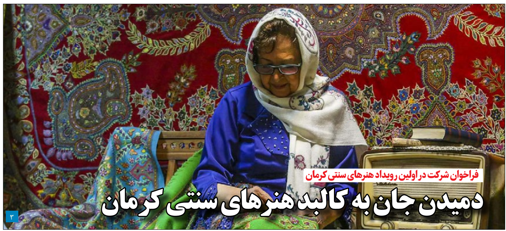
فراخوان شرکت در اولین رویداد هنرهای سنتی کرمان