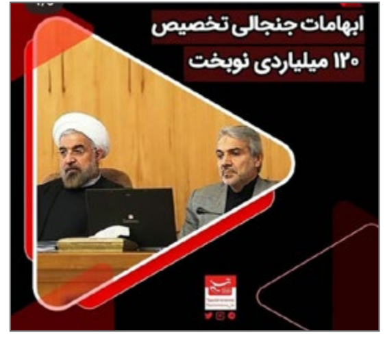
ابهامات جنجالی ۱۲۰ میلیاردی نوبخت از صفحه tabnak