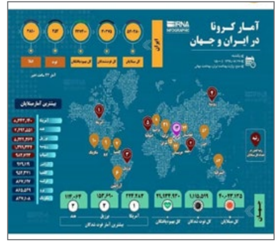
آمار کرونا در ایران و جهان از صفحه ima_۱۳۱۲