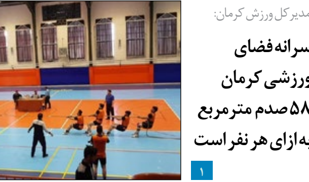
مدیرکل ورزش کرمان: سرانه فضای ورزشی کرمان ۵۸ صدم مترمربع به ازای هر نفر است

معاون هنری و سینمایی اداره کل ارشاد اسلامی جنوب کرمان با بیان اینکه ۲ هزار هنرمند در این منطقه فعالیت می کنند گفت: تئاتر، فیلم، موسیقی، آثار ادبی و هنرهای تجسمی از جمله محورهای این جشنواره است