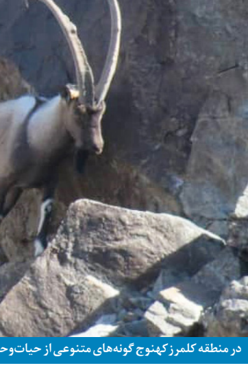
در منطقه کلمرز کهنوج گونه های متنوعی از حیات وحش دیده می شود

– حضور شما در حیات وحش منطقه تغییراتی هم به وجود آورد؟