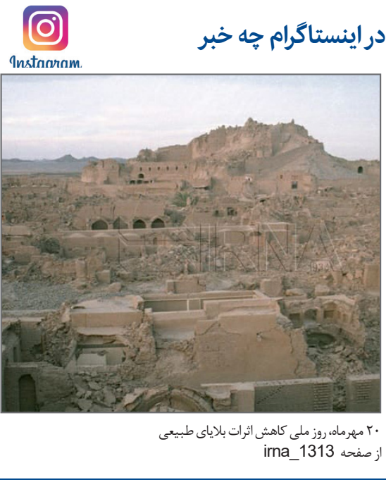
۲۰ مهرماه، روز ملی کاهش اثرات بلایای طبیعی از صفحه ima_1313