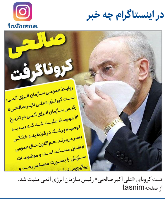
تست کرونا، «علی اکبر صالحی» رئیس سازمان انرژی اتمی مثبت شد.