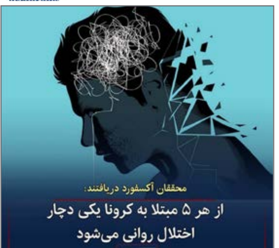
از ۵ بیمار کرونایی یکی به اختلال روانی دچار می شود.