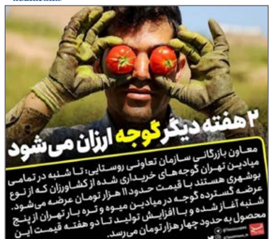
تا دو هفته دیگر گوجه رنگی ارزان می شود.