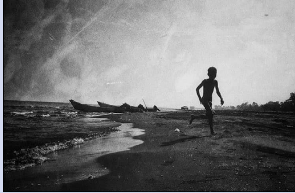
عکس: آیدا گنجی پور

باز می گردم؛ ماهیان نیمه جانم را می دوم دنبال حوضی، بر کای، چیزی. بر گلوئی تو حس ماهی های دریا دیده دارم. سیدعلی میرافضلی