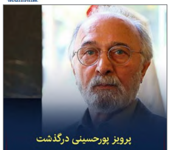
پرویز پورحسینی درگذشت