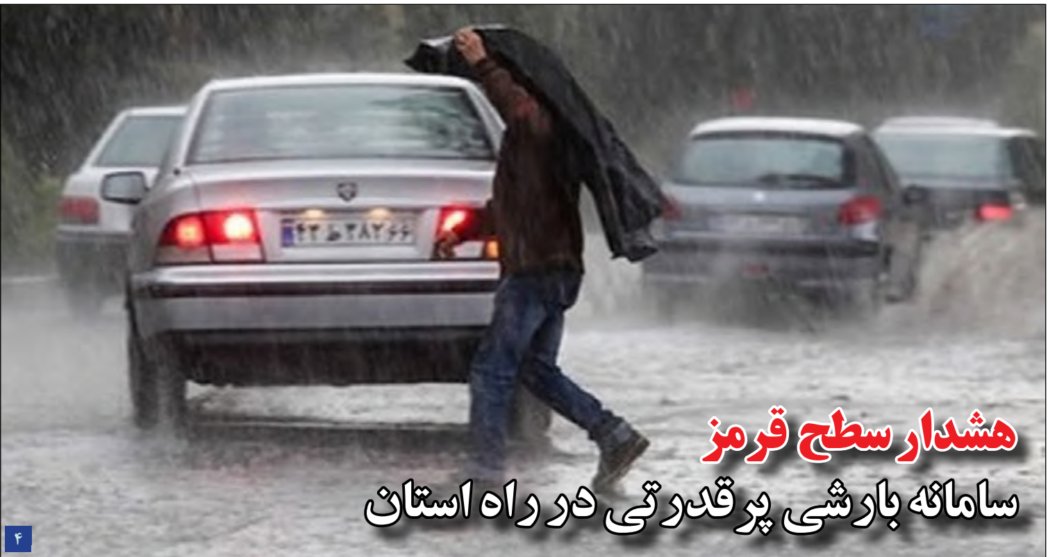
هشدار سطح قرمز سامانه بارشی پر قدرتی در راه استان

اظهارات اخیر استاندار مبنی بر عدم توقف طرح انتقال آب از هلیل رود باعث تشویش اهالی جنوب استان شده است. استاندار: فقط ۱۱ کیلومتر از این طرح باقی مانده و متوقف نمی‌شود، برای جنوب نیز انتقال آب از دریای عمان را پیگیری می‌کنیم.