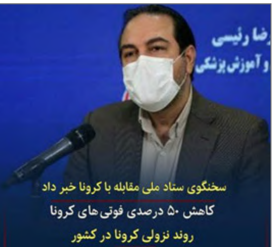
سخنگوی ستاد مقابله با کرونا خبر داد: کاهش ۵۰ درصدی فوتی‌های کرونا از صفحه @isna.news