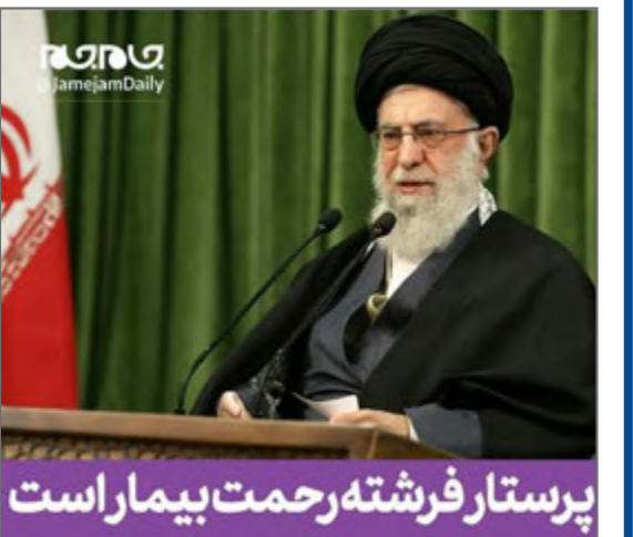
رهبر انقلاب: پرستار فرشته رحمت بیمار است.