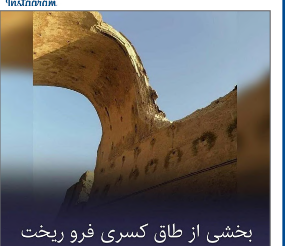
بخشی از طاق کسری فرو ریخت