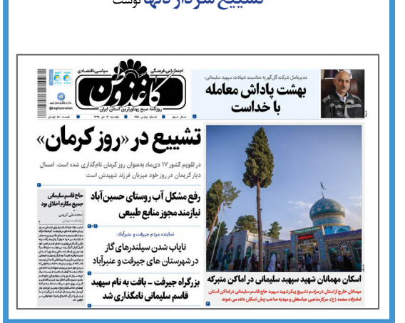
سال گذشته کاغذ وطن در چنین روزی از تاشیع سردار دلپا نوشت