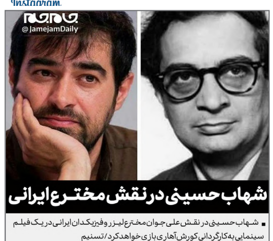
شهاب حسینی نقش مخترع ایرانی از صفحه @jamejamdaily