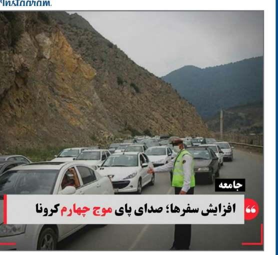
افزایش سفرها؛ صدای پای موج چهارم کرونا