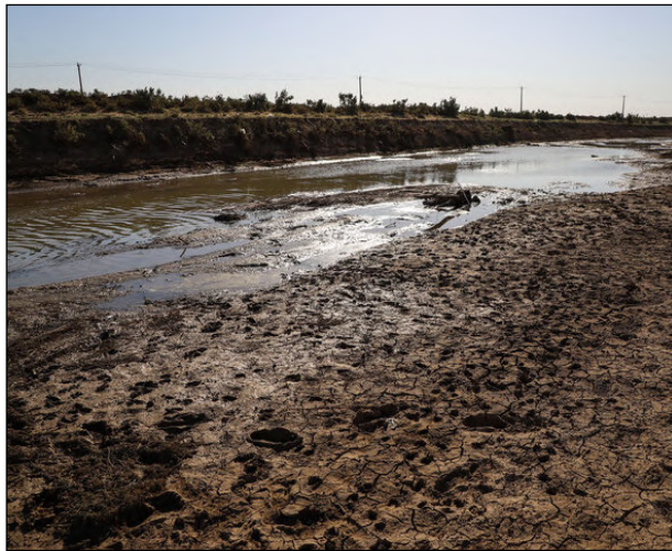
خشکسالی فریه تر می شود کاهش چشمگیر بارندگی در کرمان آنجا بیشتر به چشم می آید که بدانیم براساس آخرین گزارش مرکز ملی خشکسالی، در ۱۲۰ ماه منتهی به آذر امسال، ۶۳.۴ درصد از مساحت استان کرمان تحت تاثیر درجات مختلف خشکسالی بوده. همچنین بیش از یک چهارم مساحت استان کرمان با خشکسالی شدید و بسیار شدید دست و پنجه نرم می کند. مرکز ملی خشکسالی البته تا سال گذشته علاوه بر مساحت، گزارش جمعیت تحت تاثیر خشکسالی را هم منتشر می کرد که بر اساس آخرین گزارش آن در ۱۲۰ ماه منتهی به مهر ۹۸، بیش از ۹۰ درصد جمعیت استان تحت تاثیر درجات مختلف خشکسالی بودند.

اگرچه بارش بیش از حد معمول در سال آبی گذشته اوضاع خشکسالی را در کرمان بهتر کرده بود اما به نظر می رسد سال آبی جاری آنقدر کم باران است که پر بارشی پیشین را جبران کند. خصوصاً بر اساس پیش بینی فصلی سازمان هواشناسی که سه روز پیش منتشر شد، در ماه های بهمن تا اردیبهشت هم قرار نیست شاهد بارش چشمگیری در استان باشیم و شاید نهایتاً حدود پنج میلیمتر باران در استان بیبارد.