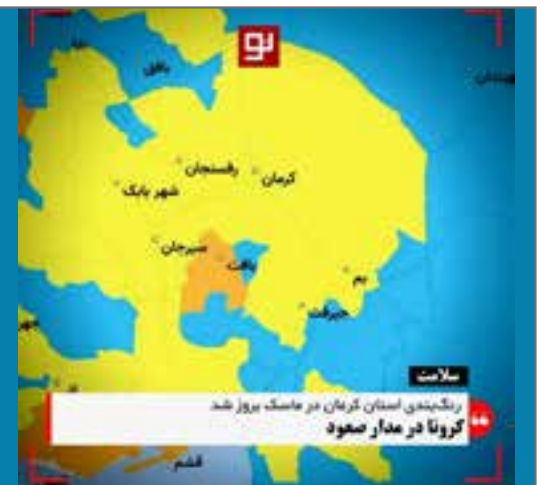
کرونا در مدار صعود از صفحه @kermaneno.tv