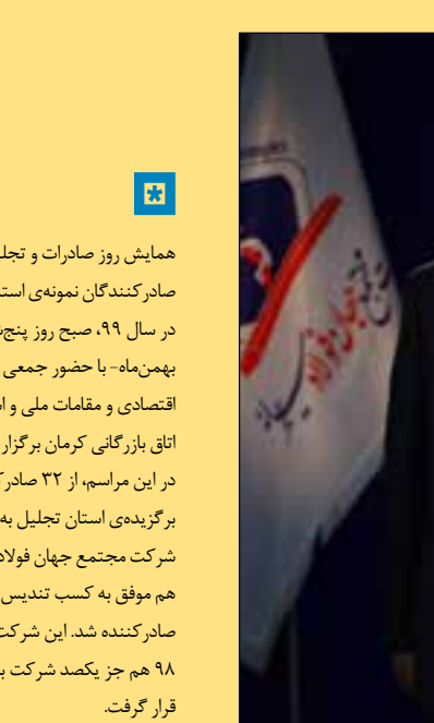
نگاهی به عملکرد شرکت مجتمع جهان فولاد سیرجان