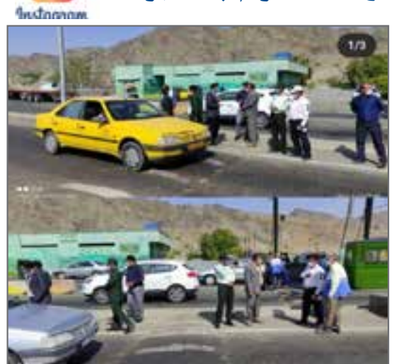
چهارمین بازدید فرماندار از ایست بازرسی شهید شبلی منوجان از صفحه farmandari_manoojan