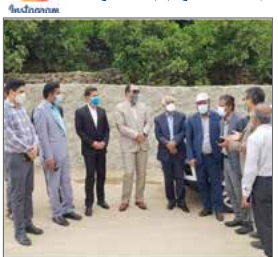
بازدید از عملیات زیرسازی و آسفالت محور روستای میجان