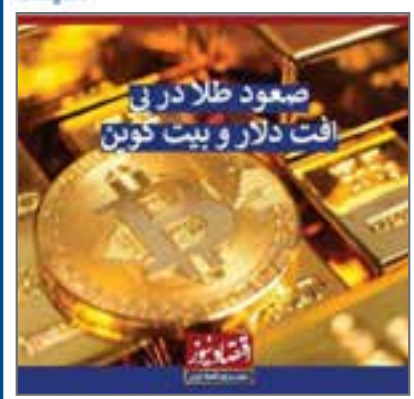
با کاهش دلار و بیت کوین، قیمت طلا افزایش یافت