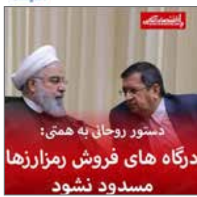
روحانی به رئیس بانک مرکزی تاکید کرد که مانع مسدودیت درگاه های فروش رمز ارز نشود