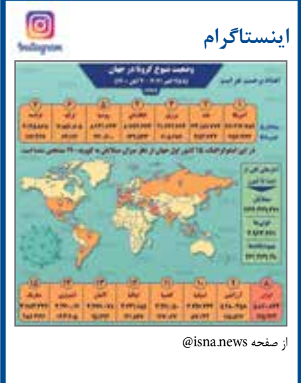
از صفحه @isna.news