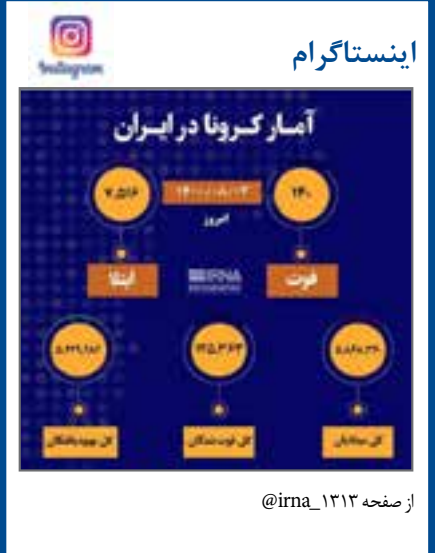
از صفحه @irna_1313