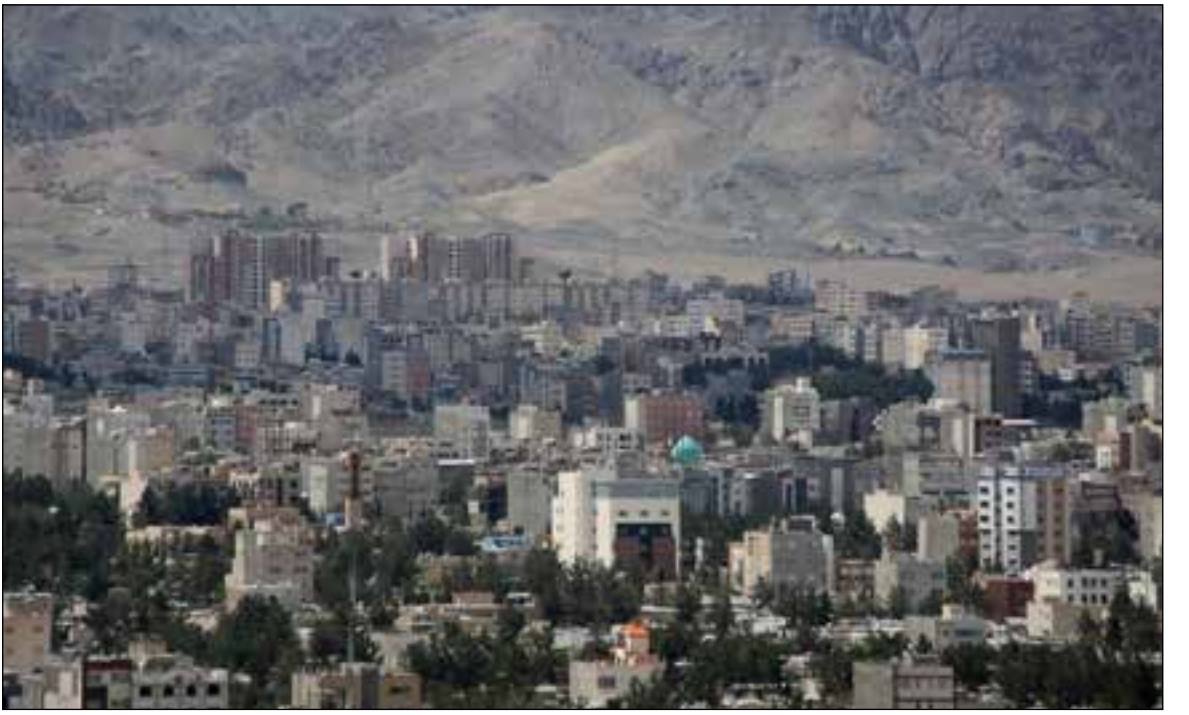
زمین‌های خضور ظرفیت‌های خارجی برای ساخت یک میلیون مسکن خواهدشد.

شیدنه شده وزیر اقتصاد اخیراً نامه‌ای هم به رئیس جمهور درباره تورم زا بودن تسهیلات ۳۶۰ هزار میلیارد تومانی ساخت مسکن ذیل قانون جهش تولید مسکن ارسال کرده است.